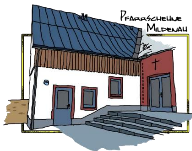
Logo der Pfarscheune Mildenaue

Außerhalb der normalen Öffnungszeiten werden zusätzlich besondere Projekte, wie Seifenkistenrennen oder Open-Air Lobpreisabende, veranstaltet.