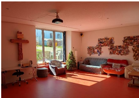
Gemeinschaftsraum im Inneren der Pfarscheune

Jugendliche zwischen circa 13 und 27 Jahren können hier unabhängig von ihrer Konfession oder Herkunft die gute Botschaft von Jesus Christus und christliche Werte kennenlernen. Es ist so ein Ort der Begegnung und der Gemeinschaft entstanden. Jungen Menschen werden Angebote zur Förderung ihrer Entwicklung bereit gestellt.